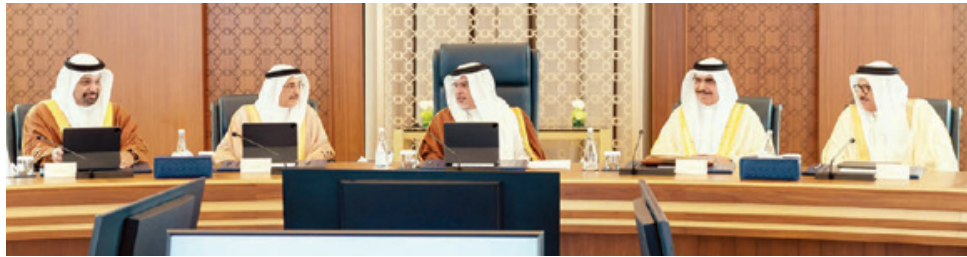
○ سمو ولي العهد رئيس مجلس الوزراء يترأس جلسة مجلس الوزراء.